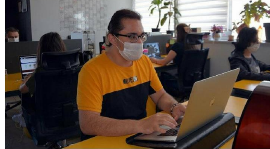
Gaziantep'te yaşayan mühendisler destek aldı.

Haber Merkezi · 08 Temmuz 2020, 10:19 · Son Güncelleme: 08 Temmuz 2020, 10:36 · AA